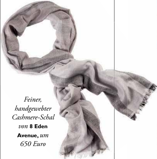
Feiner, handgewebter Cashmere-Schal von 8 Eden Avenue , um 650 Euro