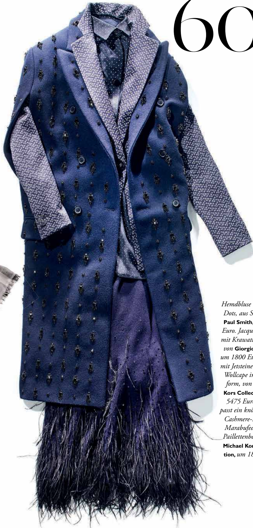
Hemdbluse mit Polka Dots, aus Seide, von Paul Smith , um 530 Euro. Jacquardblazer mit Krawattenmuster, von Giorgio Armani , um 1800 Euro. Üppig mit Jetsteinen besetztes Wöllcape in Blazer- form, von Michael Kors Collection , um 5475 Euro. Dazu passt ein knöchellanger Cashmere-Rock mit Marabufedern und Paillettenbesatz, von Michael Kors Collec- tion , um 1825 Euro