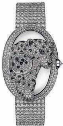
Brillantbesetzte Schmuckuhr „Panthère Ajourée“ von Cartier , Preis auf Anfrage