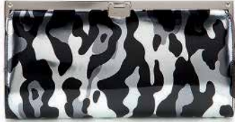
Clutch mit stilisiertem Leo-Muster, aus Metallicleder, von Jimmy Choo , ges. bei mytheresa.com , um 795 Euro