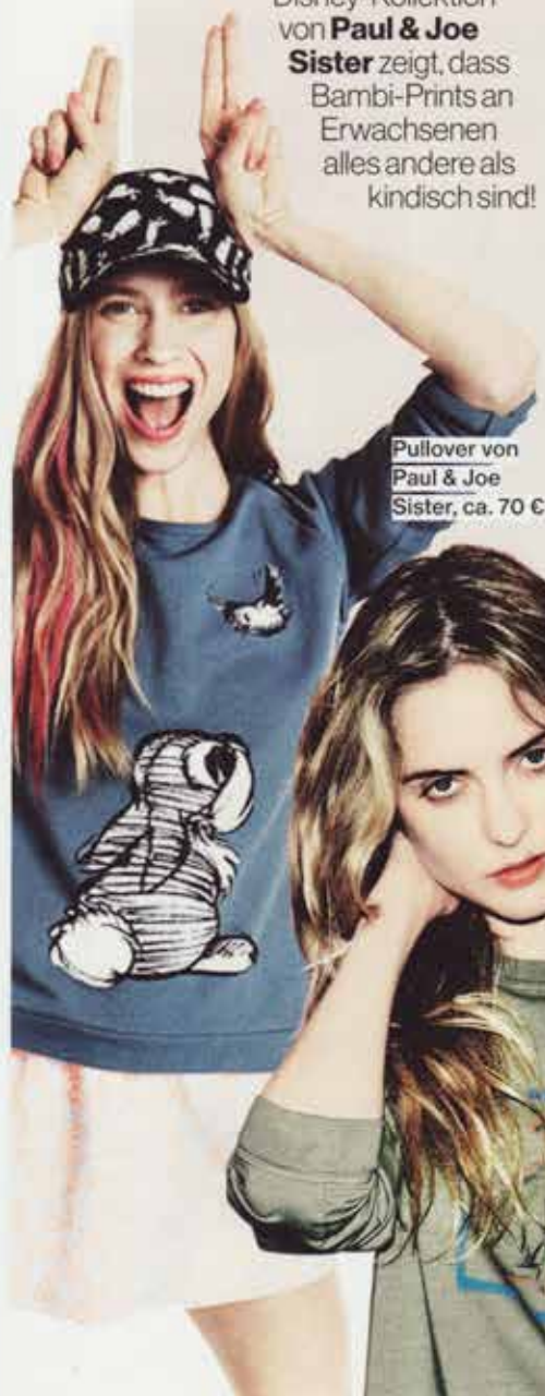
Pullover von Paul & Joe Sister, ca. 70 €

So viel ist klar: Prints auf Shirts und Pullis sind Trend. Neues Futter für Fans der Aufdrucke gibt es ab Februar im Doppel-pack. Barbour kooperiert mit der zauberhaften Designerin Bella Freud , Urenkelin von Sigmund Freud. Und die neue Disney-Kollektion von Paul & Joe Sister zeigt, dass Bambi-Prints an Erwachsenen alles andere als kindisch sind!