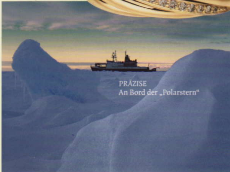
PRÄZISE An Bord der „Polarstern“