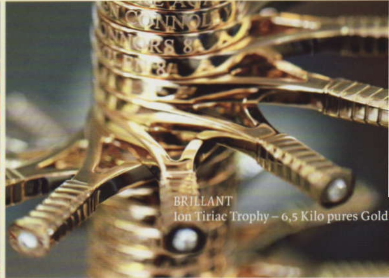
BRILLANT Ion Tiriac Trophy – 6,5 Kilo pures Gold

INSPIRATIONEN Außergewöhnliches, Überraschendes, Abenteuerliches EIN HEFT ZUM ENTDECKEN