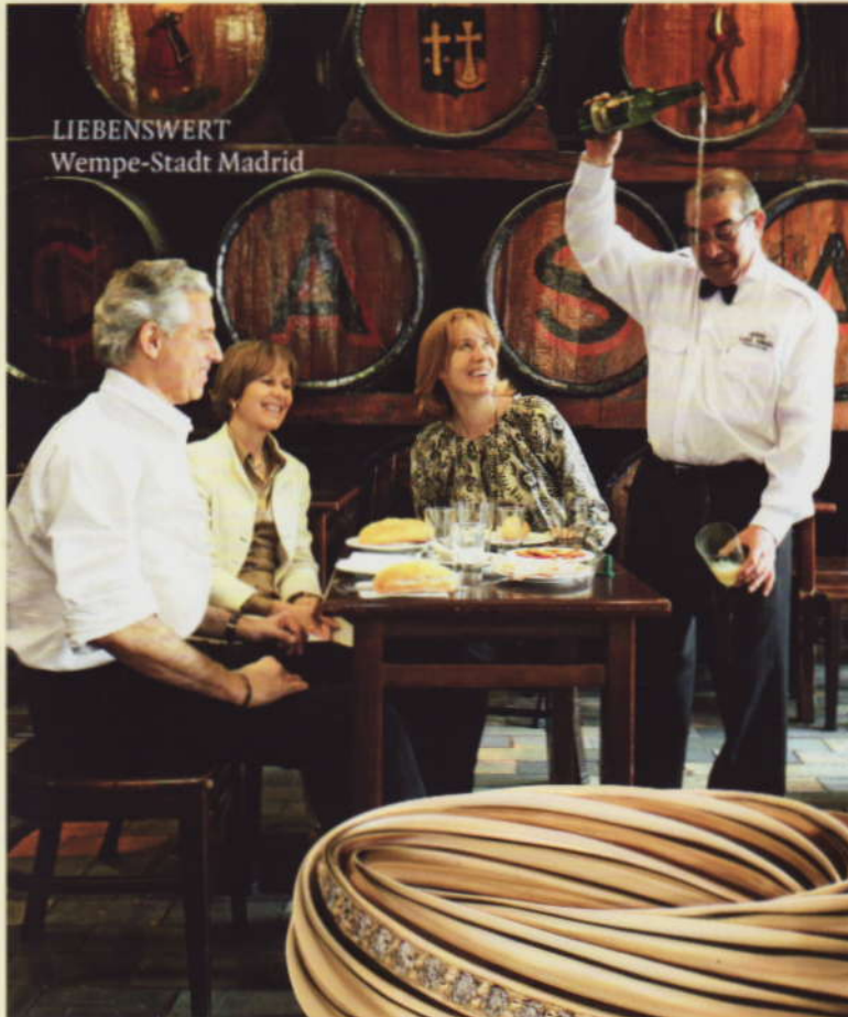
LIEBENSWERT Wempe-Stadt Madrid